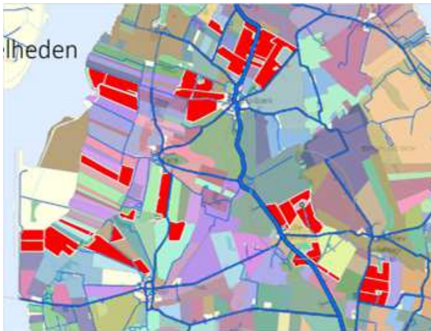
Landbrugsstrukturen i dag

Beliggenhed af jorde (med rød farve) på en typisk heltidsbedrift.